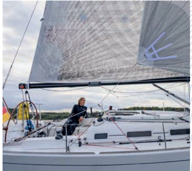
Gute Sicht durch hochgeschnittene Schotecke eines Cruising Code Zeros mit Klettbändern zum sicheren Aufrollen.

Als Materialien stehen speziell hierfür entwickelte Mylar/Aramid Lamine zur Verfügung. Diese sehr weichen, einseitig Taffeta beschichteten Tücher sind extrem unempfindlich.