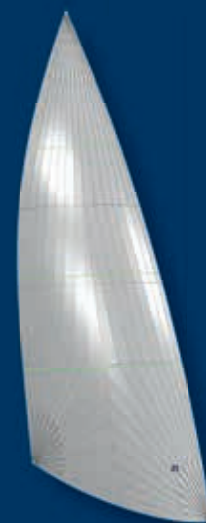
CODE ZERO 55 mit 50-55% Mittelbreite