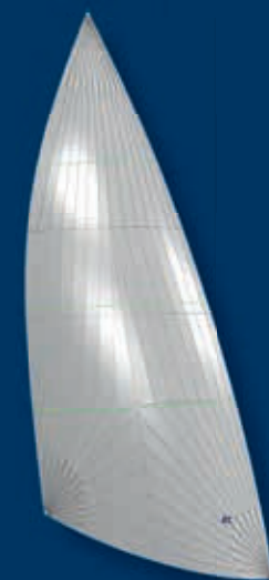
CODE ZERO 65 mit 60-65% Mittelbreite