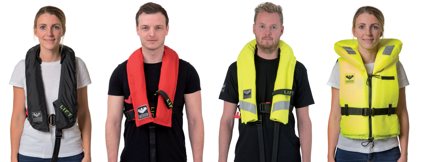
VIKING RescYou™ Conquest

Ihre Sicherheit ist unsere höchste Priorität. Alle Rettungswesten blasen sich in Sekundenschnelle auf, sind selbstauffrichtend und verfügen über wichtige Sicherheitsmerkmale wie einen Taliengurt, SOLAS Reflexstreifen und eine gut sichtbare Hebeschlinge. In Notfällen zählt jedes Detail.